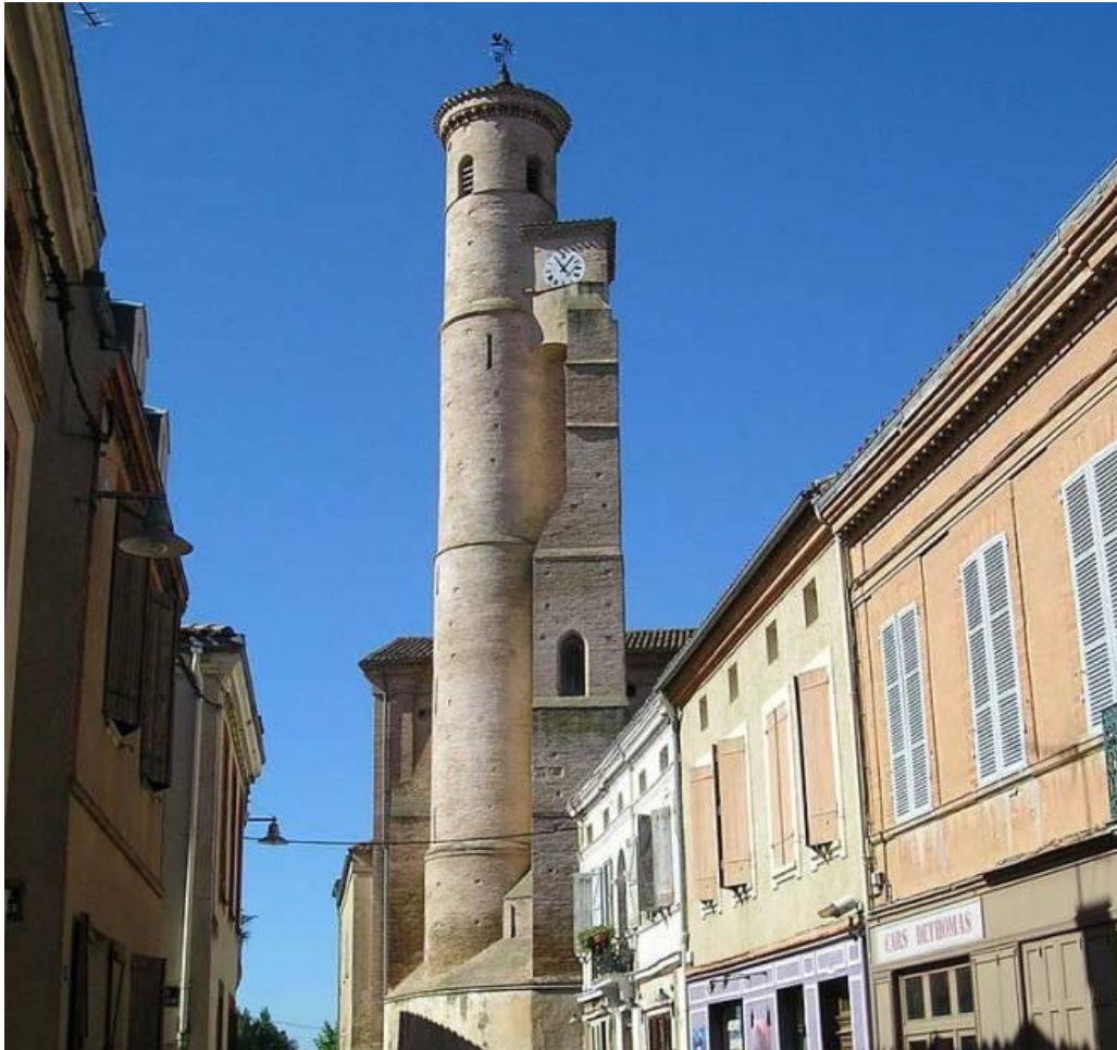
Le clocher de la Collégiale St-Martin de L'Isle-Jourdain